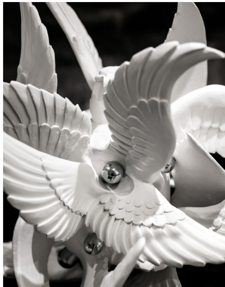
La Grenade Faïence, aluminium 29x37x35 cm