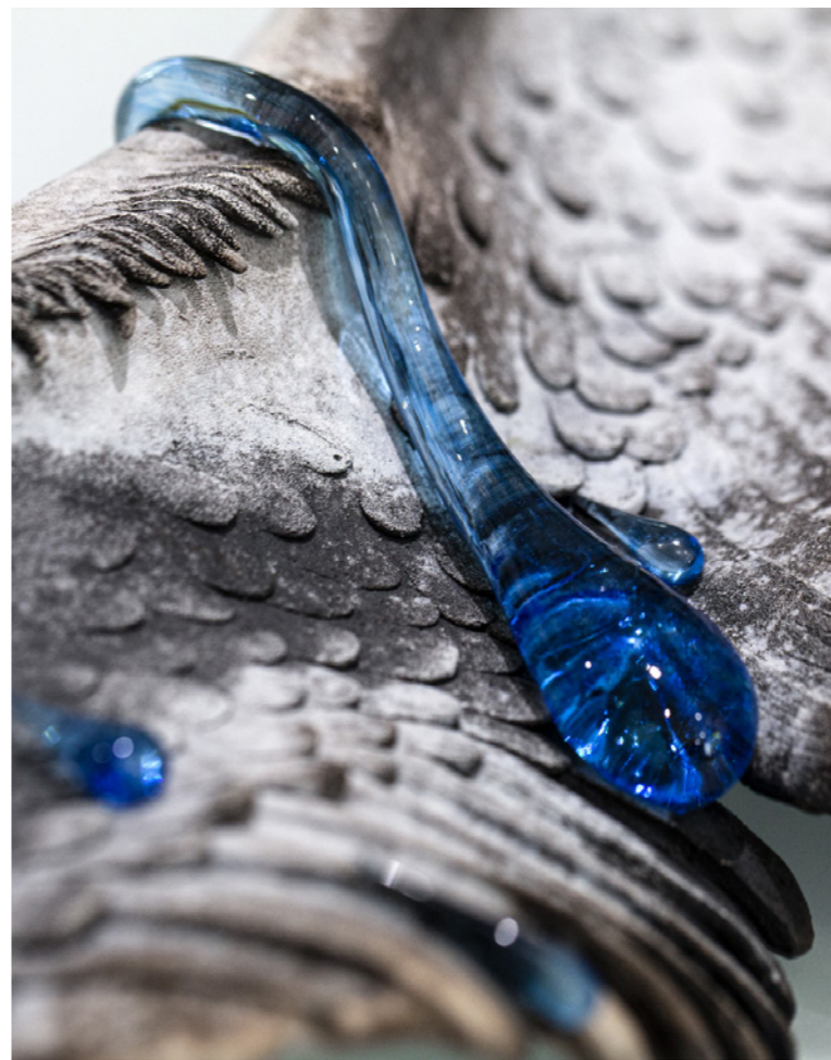
Phénix grès enfumé, verre 2 X 65 x 35 x 10 cm