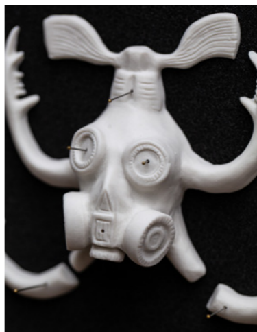
Guère épais porcelaine, papillons, émailène, épingles 100 x 100 x 5 cm